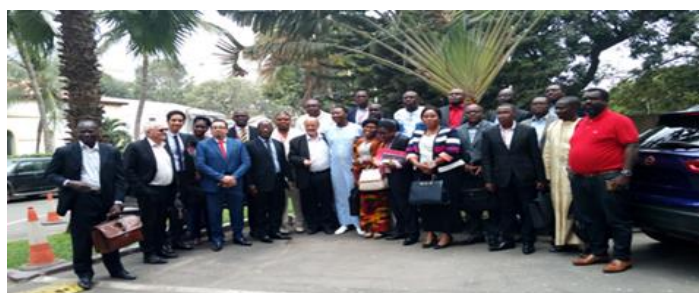
Un groupe de Doctorants professionnels africains de l'ASMP, avec quelques Professeurs-Directeurs de thèses (Dakar 2018)

Animé par des enseignants-chercheurs confirmés et reconnus au plan international, le programme de l'Executive DBA repose sur l'expérience avérée des participants en entreprise pour les conduire à intégrer une démarche de recherche à travers des séminaires.