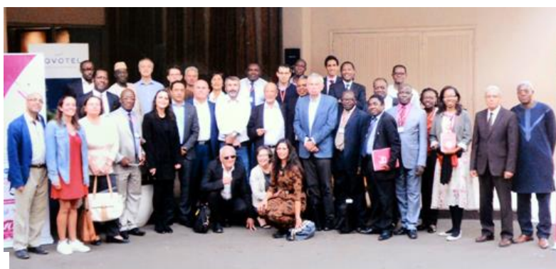
14 e Rencontre Internationale de Dakar (IAS-Doctoriales ASMP) du 12 au 15 Décembre 2018